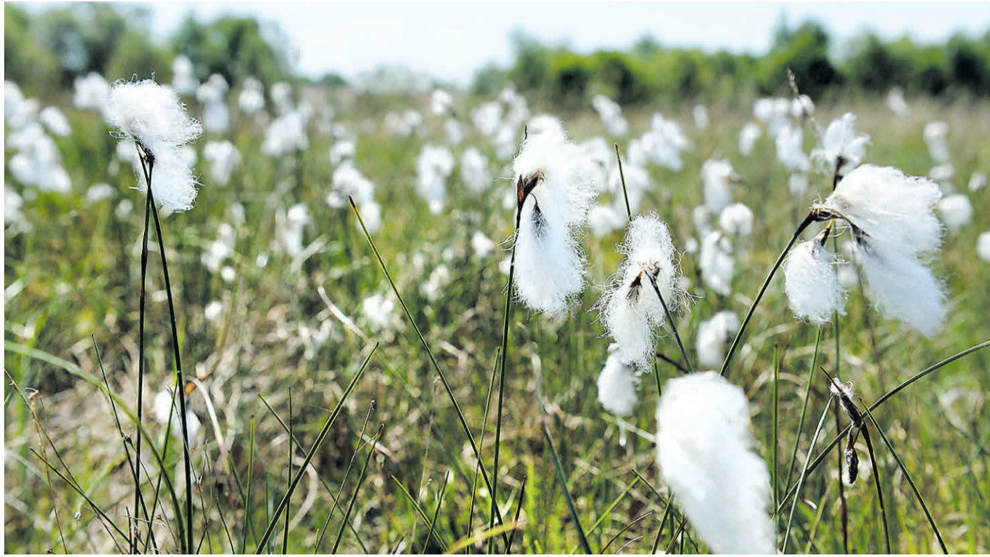
Sind unentbehrliche Verbündete im Kampf gegen den Klimawandel: Hochmoore speichern Kohlendioxid. Werden sie abgetorft, gelangt das Kohlendioxid als Treibhausgas in die Atmosphäre.