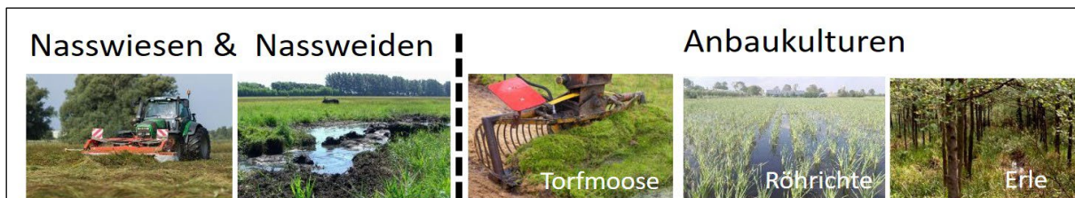
Abb. 1: Paludikulturen umfassen Nasswiesen, Nassweiden und die gezielt etablierten Anbaukulturen (Nordt et al. 2022).

Alle Paludikulturen sind Dauerkulturen, bei denen die oberirdische bzw. im Fall von Torfmoosen neu aufgewachsene Biomasse genutzt wird. Voraussetzung ist, dass die durchschnittlichen Wasserstände beständig in Flurhöhe oder nur maximal 10 cm darunter liegen – die Flächen also „nass“ sind. Unterschieden werden können sie nach der Art ihrer Nutzung und Etablierung: Angepasste Pflanzengemeinschaften bilden sich in Abhängigkeit vom Wasserstand und Moortyp auf natürliche Weise aus. Bei sommerlicher Mahd entstehen Nasswiesen, bei Beweidung Nassweiden. Anbau-Paludikulturen entstehen durch die gezielte Etablierung von moortypischen Arten wie z.B. Schilf, Rohrkolben, Anbaugräsern oder Erle auf Niedermooren bzw. Torfmoos sowie Sonnentau oder Beeren auf Hochmooren (Birr et al. 2021, Närmann et al. 2021, Nordt et al. 2022). Schwerpunktfelder für Anbau-Paludikulturen sollten vormals tief entwässert und deshalb stark degradierte Moore sein (s. S. 7).